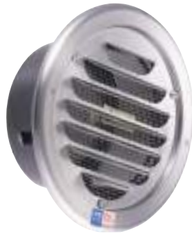
GVD-100HL-KT (クリア / 防虫網付)