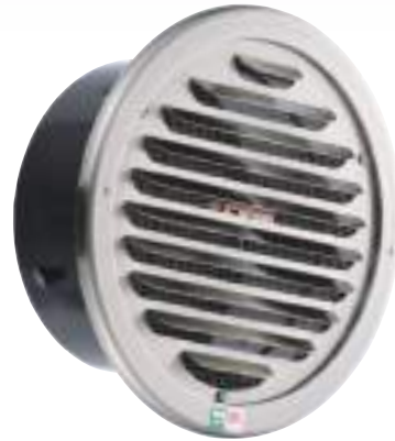
GVD-150HL-KT (クリア / 防虫網付)